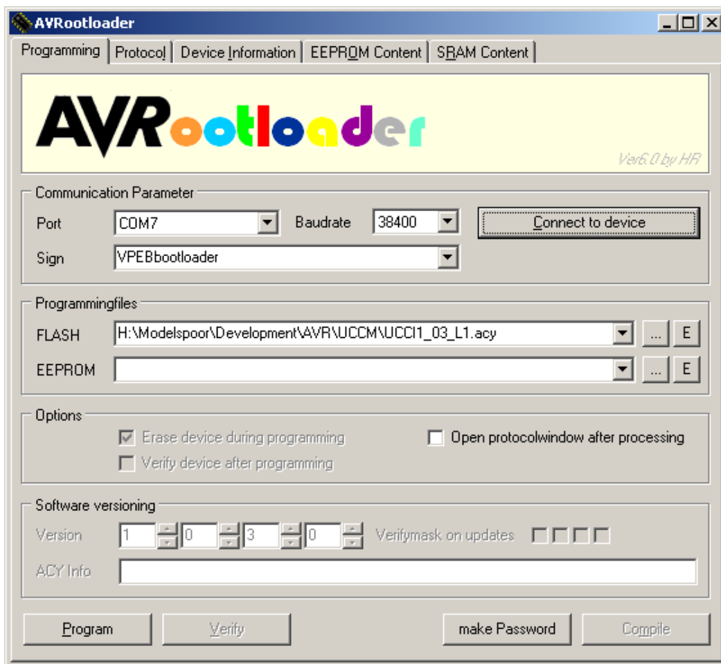
Fig 1: AVRRootloader