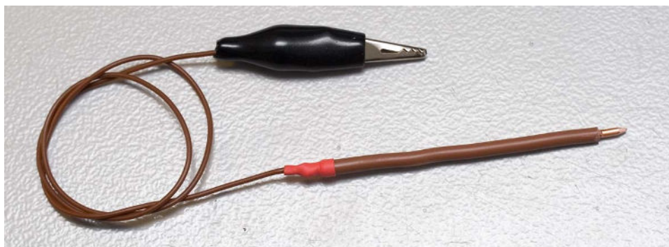
Fig 3: Testpen met krokodilleklem

Voor het draadje, om de CPU in Bootloader Mode te krijgen, kun je volstaan met een simpel geïsoleerd koperdraadje. Wil je het risico verminderen dat je per ongeluk kortsluiting maakt dan kun je beter het uiteinde dat je op de CPU-pin zet voorzien van een "stevig" uiteinde dat je goed kunt vasthouden. Zo'n "testpen" kun je eventueel zelf maken van een stukje geïsoleerd (230V) installatiedraad (ca 8 cm). Strip van één uiteinde een klein stukje isolatie (ca 8 mm) en vijl het uiteinde in een puntje. Strip van het andere uiteinde een klein stukje isolatie en soldeer hieraan een stukje soepel koperdraad. Zet bij voorkeur een stukje krimpkous over het soldeerpunt, zodat het weer geïsoleerd is. Wil je het jezelf helemaal gemakkelijk maken, maak aan het andere uiteinde van het koperdraadje een krokodilleklemmetje. Het geheel ziet er dan ongeveer uit zoals fig 3. Als je de "testpen" geruime tijd niet gebruikt hebt en je wilt 'm weer gebruiken, maak hem dan eerst even goed schoon door het puntje licht over een stukje fijn schuurpapier te halen.